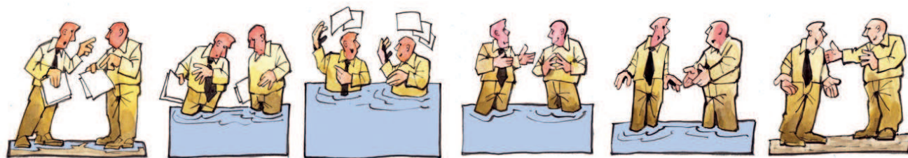
Figuur 1: Samen werken op basis van afspraken in plaats van generieke normen

Met de komst van de Waterwet en onderliggende uitvoeringsbesluiten zijn de verantwoordelijkheden rond (afval)waterbeheer herverdeeld en verankerd. Hierbij is samenwerking tussen overheidspartijen het uitgangspunt. Om alle taken en plichten goed te kunnen uitvoeren, werken gemeenten en waterbeheerders (waterschappen en Rijkswaterstaat) samen en zetten hun bevoegdheden gezamenlijk in. Dat is de voorwaarde voor het optimaal benutten van de wettelijk geboden beleidsvrijheid om het (afval)waterbeheer naar de eisen en wensen van burgers, bedrijven en de fysieke leefomgeving vorm te geven.