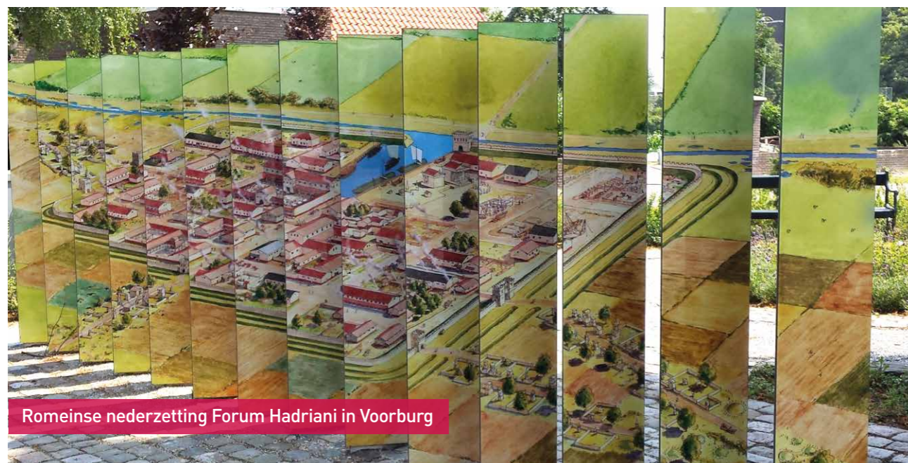
Romeinse nederzetting Forum Hadriani in Voorburg