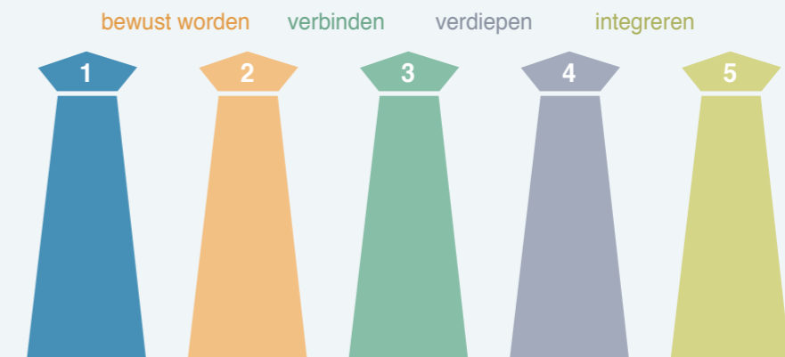
Bewerking H2Ruimte van Ontwikkelingsmodel ondergrond opgesteld in opdracht van SKB door provincies Zeeland, Overijssel en gemeente Rotterdam

Het torentjesmodel schetst het ontwikkelproces dat ruimte en ondergrond doorlopen om te komen van een situatie waarin er nauwelijks kennis en ervaring met het andere werkveld is (toren 1) tot een (ideale) situatie waarin het verschil tussen onder- en bovengrond er niet toe doet en het altijd vanzelfsprekend is dat ruimte en ondergrond elkaar nodig hebben (toren 5). Om van toren 1 naar toren 5 te komen, onderscheidt het model de volgende stadia: